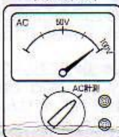
(例)一般正弦波用テスター (アナログタイプ)